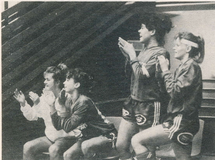
Jublande glada IFK-tjejer efter seger med 1-0 i SIF-cupens final mot Hedemora.