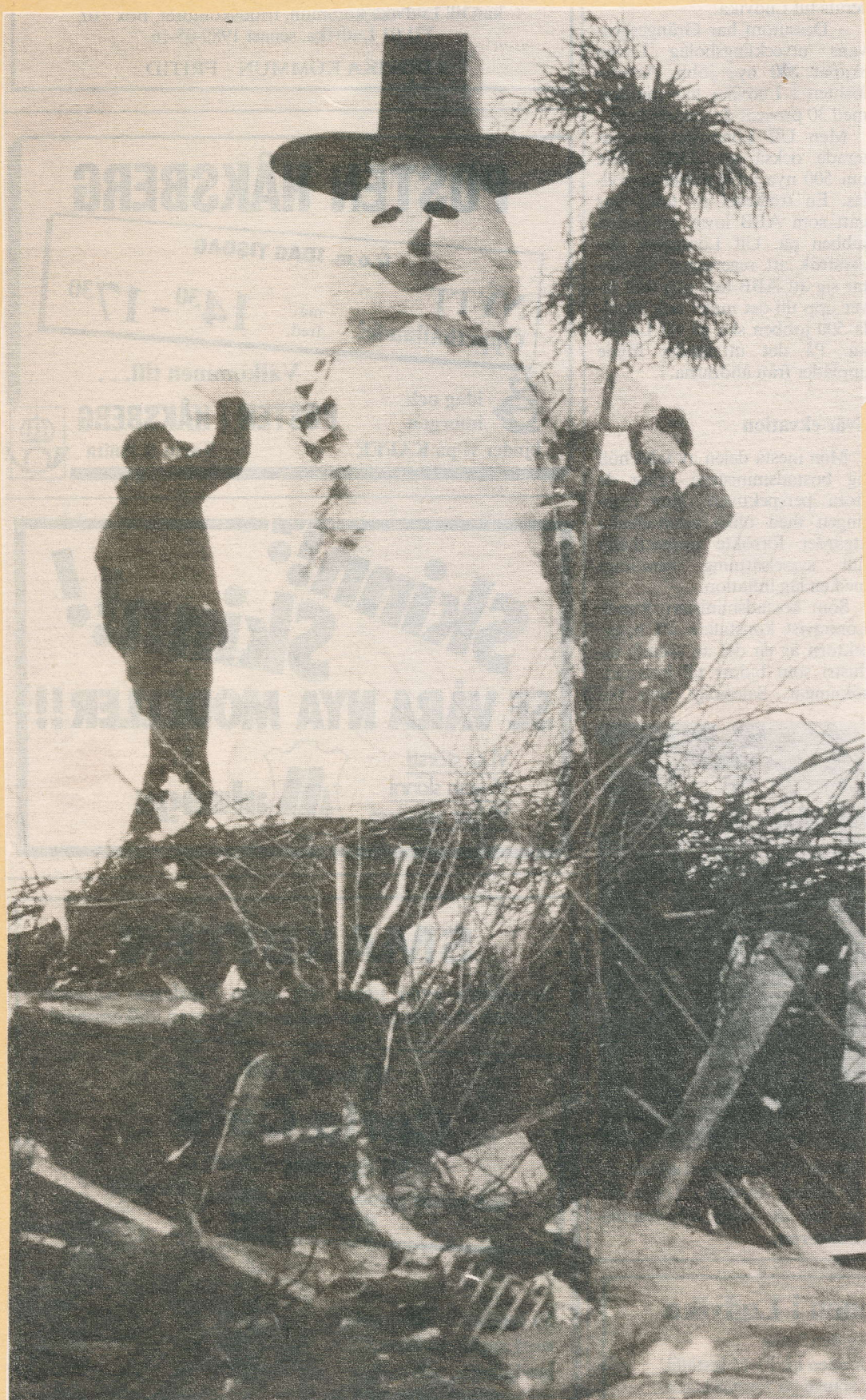
Så stod den där igen, snögubben som traditionsenligt brukar toppa Saxdalens majbrasa. Fast i år var den av naturliga skäl gjord av papp. Men traditioner är ju till för att hållas...